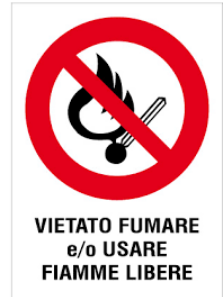
VIETATO FUMARE e/o USARE FIAMME LIBERE

L'incendio è la combustione (reazione chimica di un combustibile con un comburente in presenza di innesco) sufficientemente rapida e non controllata che può svilupparsi senza limitazioni nello spazio e nel tempo. Il rischio di incendio è sempre presente in qualsiasi attività lavorativa.