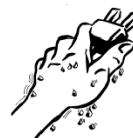
NO MANI BAGNATE